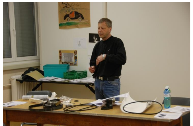
Atelier sugli elementi meccanici rotativi