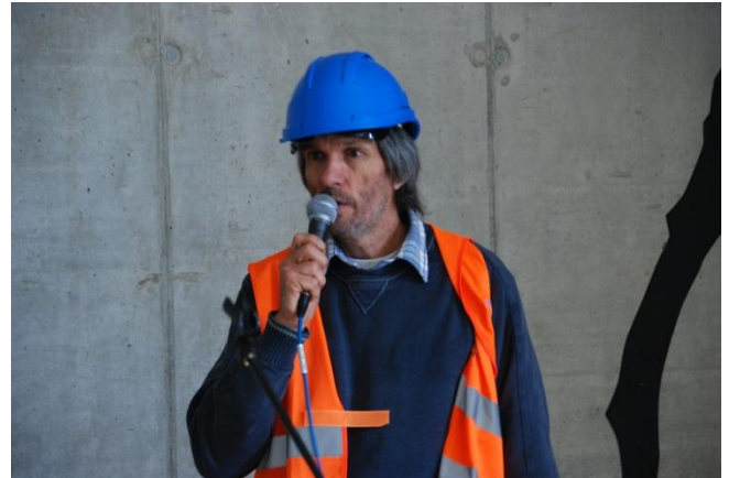
Atelier sull'hooliganismo e la gestione del pubblico