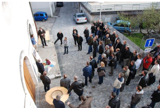
Visita della Cantina di St Germain